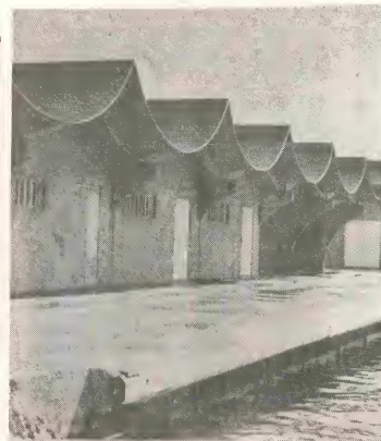
E facilidnan pa vende fruta, berdura etc. ta den nan fase final di construccion.